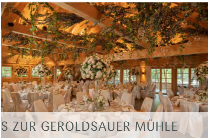
„HOCH“-ZEITEN IM WIRTSCHAUS ZUR GEROLDSAUER MÜHLE